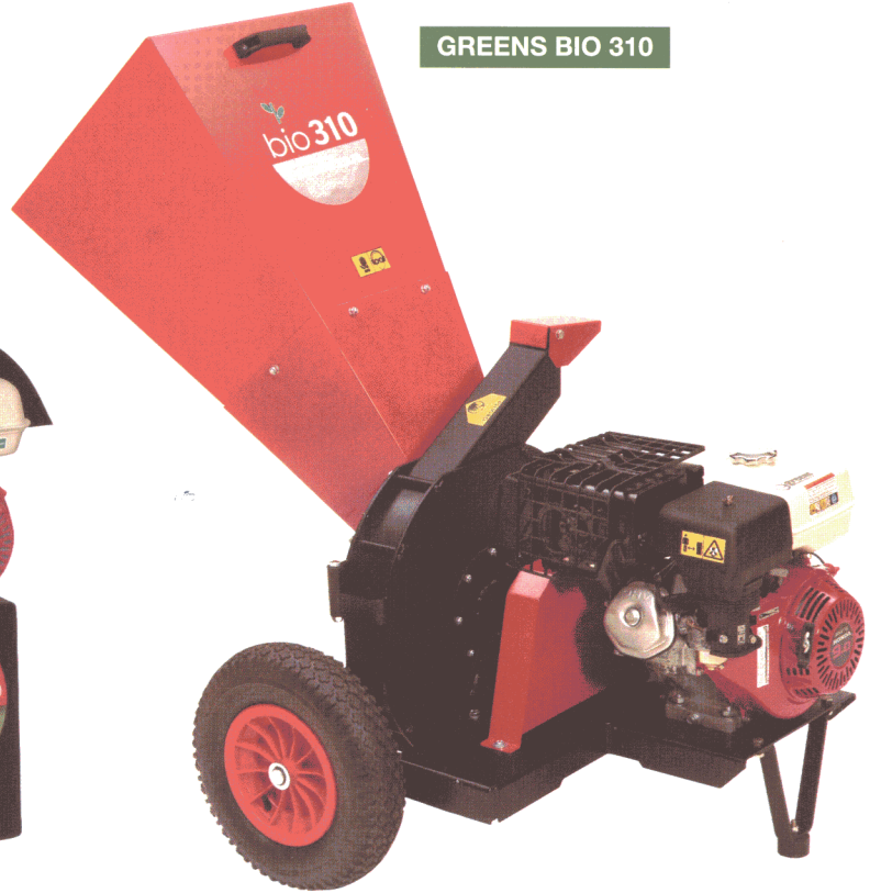
GREENS BIO 310